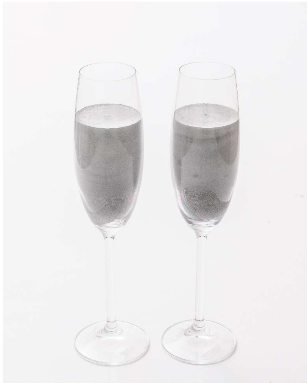
Perfect lovers Copas de cristal y concreto Objeto 2014