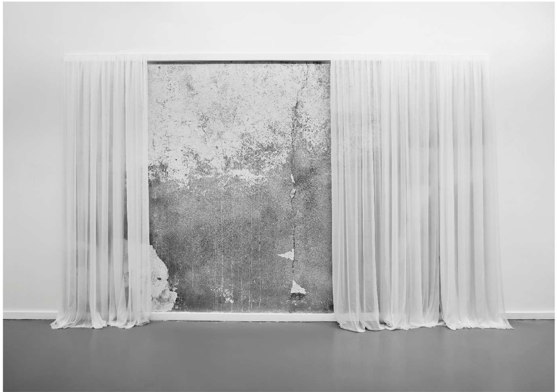
Muro desnudo Instalación 450 x 350 cm 2014