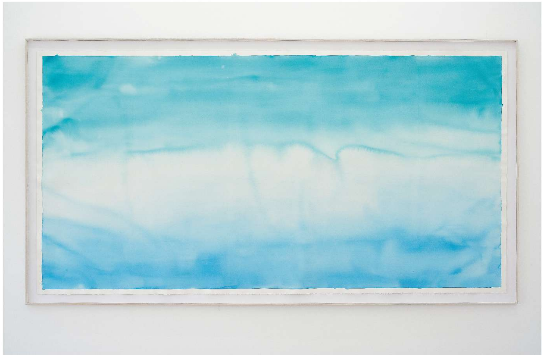
Blue in green Acuarela sobre cartulina arches 220 x 113 cm 2021