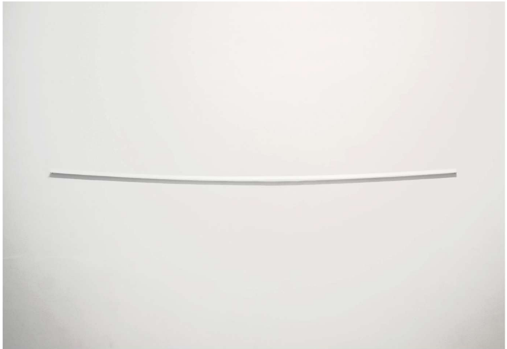
Almost straight Espejo 214 x 1 cm 2017