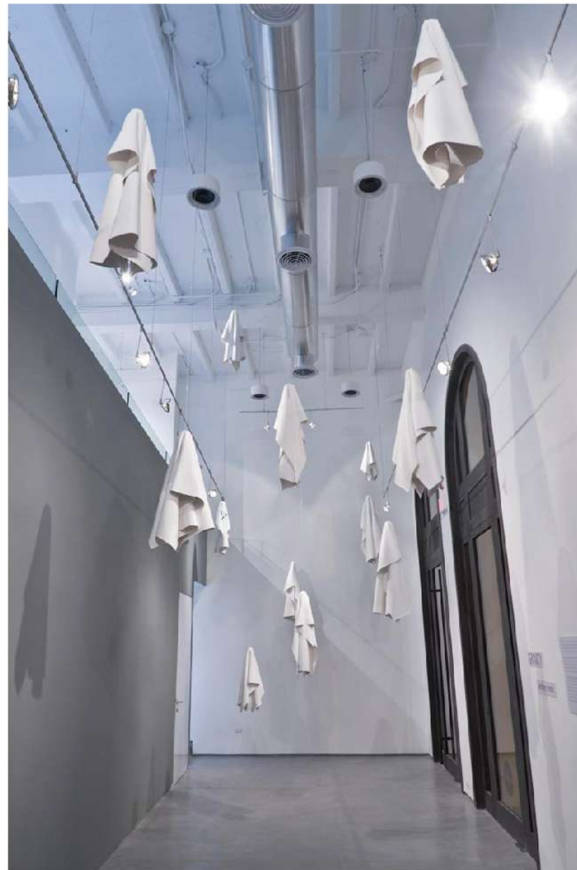
Ghosts Telas construidas íntegramente con pintura acrílica blanca Instalación 2012